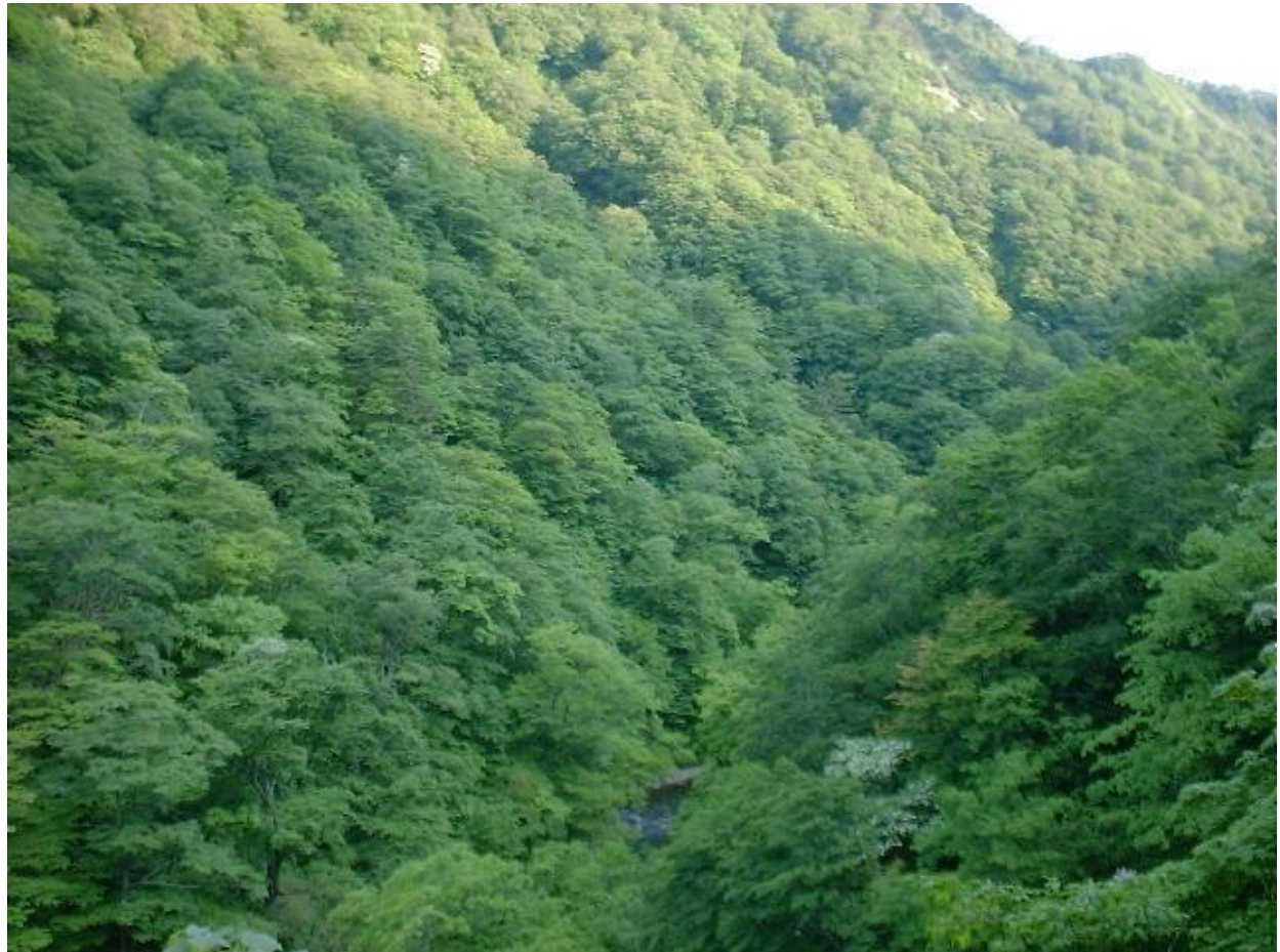
ダム湛水域とされてしまった北ノ俣沢の中流域