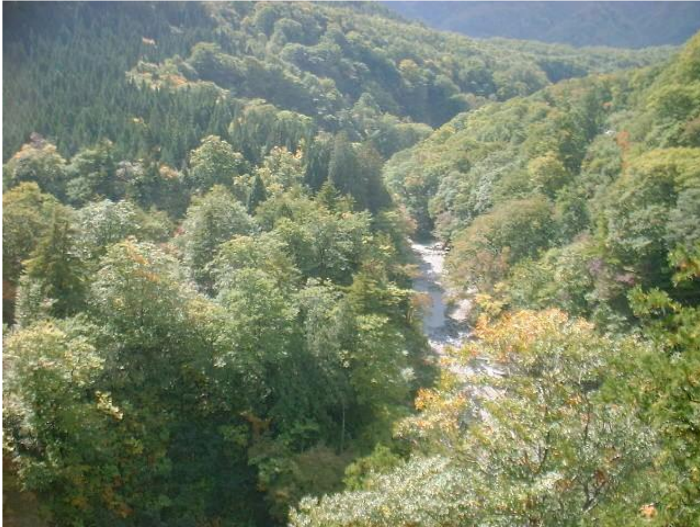
ダム湖北側に沈む北ノ俣沢の下流域