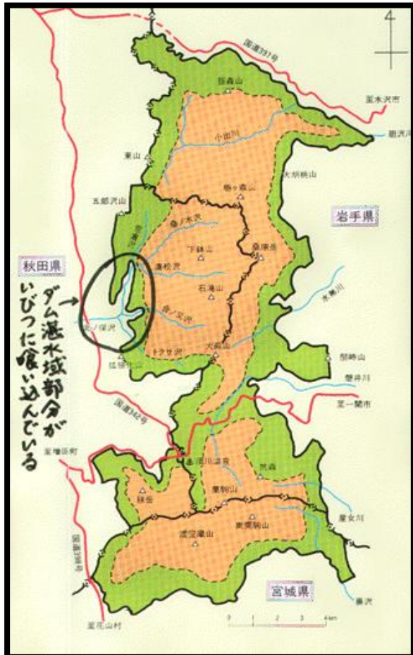
栗駒山・栃ヶ森山周辺森林生態系保護地域 (合計16,310ha) (参考:白神山地世界遺産は17,000ha)