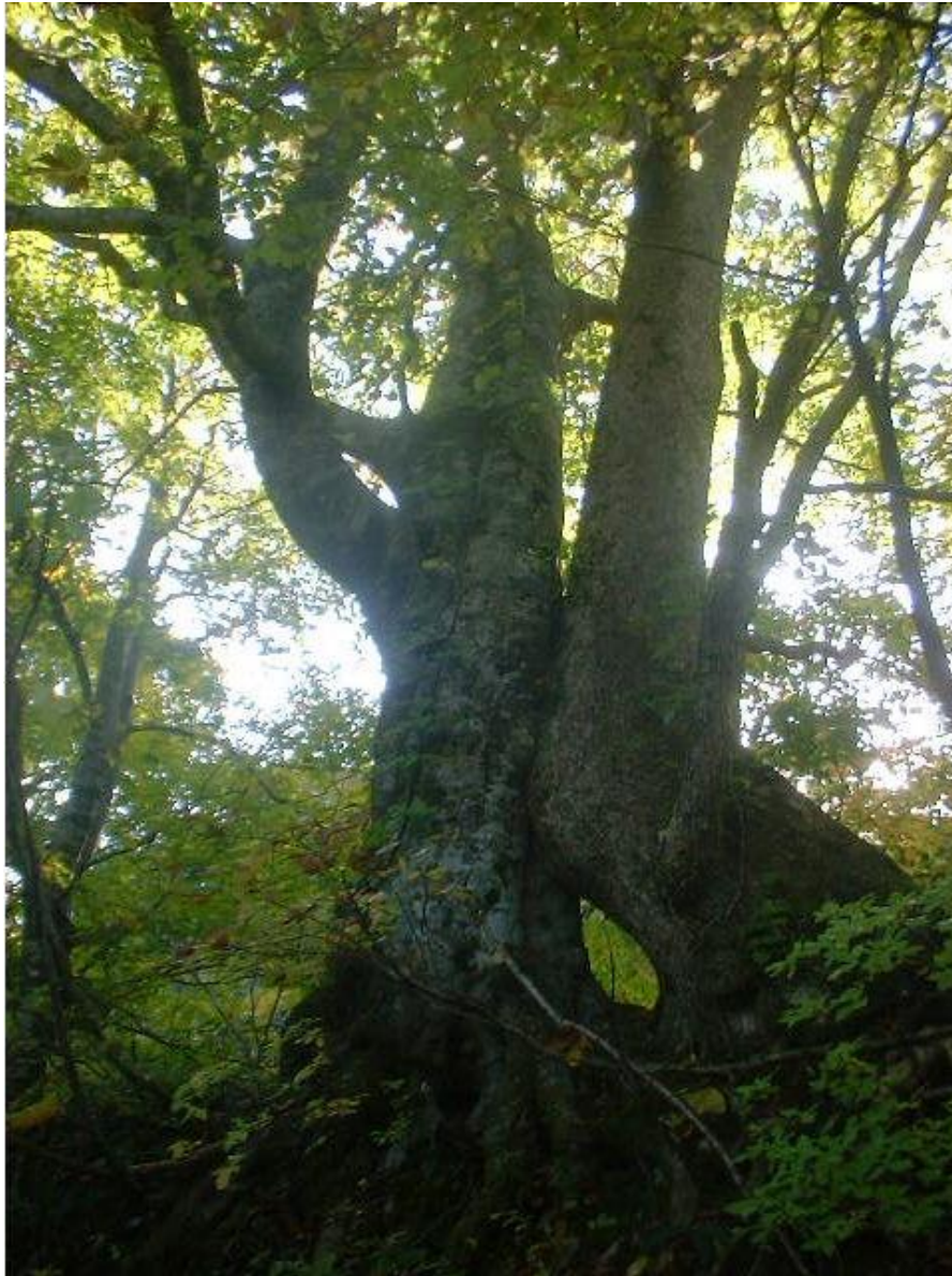
合体しながら成長したブナ（左）とナラ